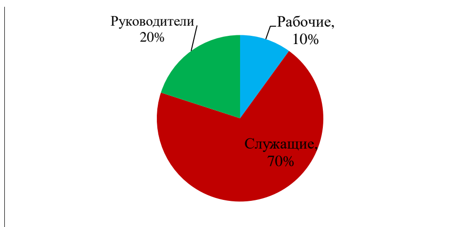
Рис. 1 Социальный статус семей учащихся

Социальный статус семей учащихся, социальный статус обучающихся наглядно представлены на рисунках 1, 2.