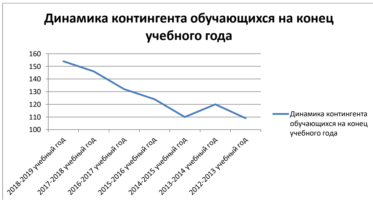
График 1. Динамика контингента обучающихся, всего чел.

Учреждение вправе открывать группы продленного дня по запросам родителей (законных представителей). Количество классов и групп продленного дня в Учреждении определяется потребностью населения, зависит от санитарных норм